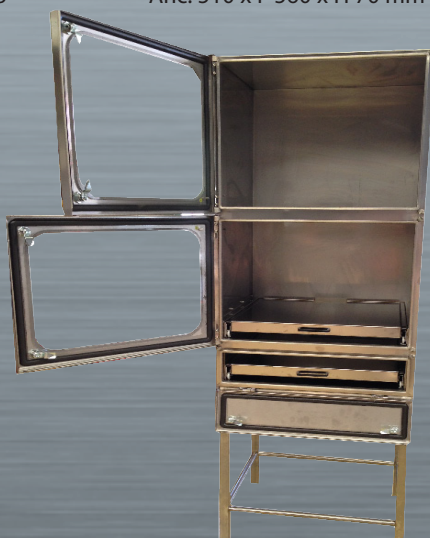
MU 3 acero inoxidable abierto