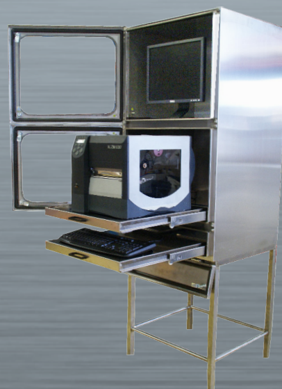
MU 3 acero inoxidable