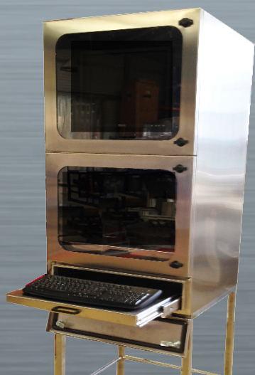
MU 3 Acero inoxidable con la bandeja extraíble del teclado