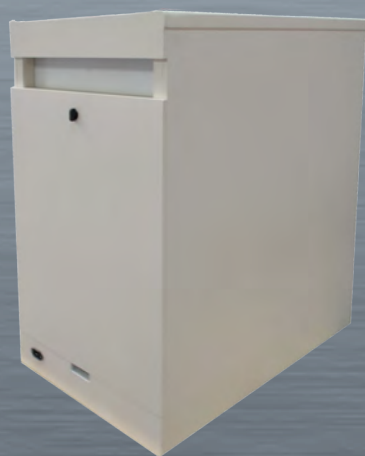
ISS 1 : Vista de la parte trasera