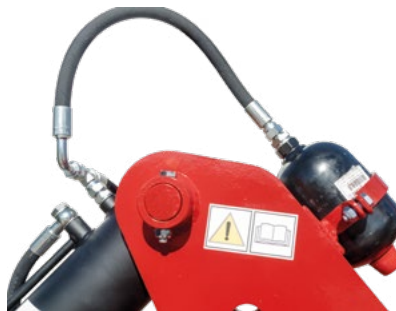
Suspensión por acumulador de nitrógeno