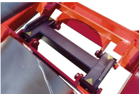
Sistema exclusivo de adaptación al terreno