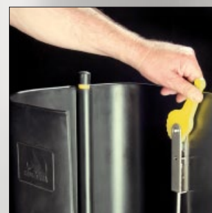
13 Posiciones de regulación. Control al detalle para dosificar el alimento.

Dos han sido los aspectos que se mejoran para ese fin: