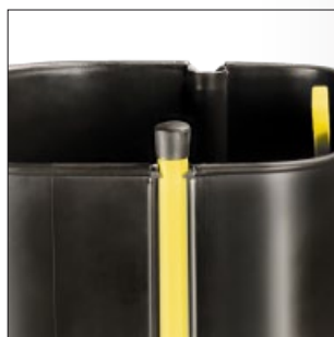
Especial diseño anticondensación. Tubo de PVC con posibilidad de instalarlo a uno u otro lado de la tolva.